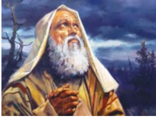
படம் 5.1 - ஆபிரகாம்

ஆதாம், ஏவாள் பாவம் செய்தபின், ஒரு மீட்பரை அனுப்பி மனித இனத்தைப்பாவத்திலிருந்துவிடுவிப்பதாக ஆண்டவர் வாக்குறுதியளித்தார். அந்த வாக்குறுதியை நிறைவேற்றுவதற்காக ஆண்டவர் தேர்ந்து கொண்ட முதலாவது நபர் ஆபிரகாம் ஆவார். இவர் குலமுதுவர் என அழைக்கப்பட்டார். இவ்வாறு ஆண்டவர் ஆபிரகாமைத் தேர்ந்து கொண்டமை, அவருக்களித்த சிறப்பான அழைப்பின் ஆரம்பமாகும். அந்த அழைப்பு திருவிவிலியத்திலே இவ்வாறு குறிப்பிடப்படுகின்றது.