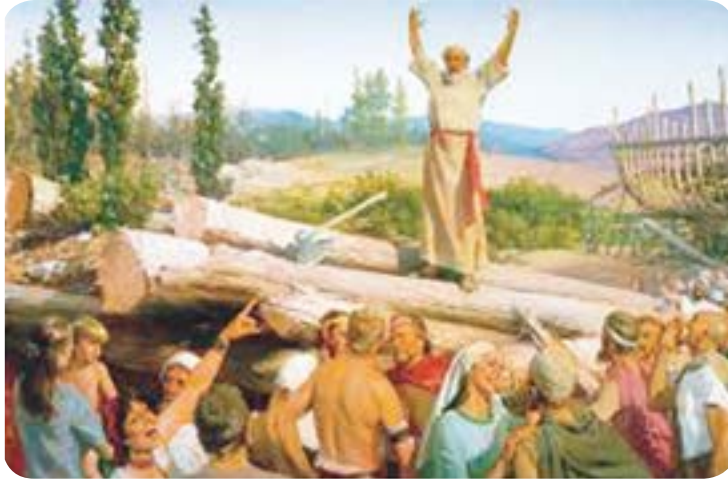
படம் 1.1 - இறைவாக்கினரின் அழைப்பு

ஒரு கண்ணாடியைச் சூரிய ஒளி படும் வண்ணம் பிடிக்கும்போது தேவையான இடத்துக்கு அவ்வொளியைத் தெறிக்கச் செய்கின்ற ஆற்றல் அதற்கு உள்ளது. இதன்படி, கண்ணாடியிலிருந்து தெறிக்கப்படுவது கண்ணாடியில் பரவியுள்ள ஒளிக்கதிர்களேயாகும். ஒரு கண்ணாடி செய்கின்ற வேலையைப்போல செய்ய தனி ஆட் குழுவினர் பழைய ஏற்பாட்டில் இருந்தனர். “இஸ்ரவேல் இறைவாக்கினர்” என்பவர்களே இவர்களாவர். இறைவனின் செய்தி இவர்களை நோக்கி வந்தபோது இஸ்ரவேல் மக்களுக்கு இவர்கள் அதனை வெளிப்படுத்தினர். சீழே உள்ள படத்தில் இதன் பிரதிபலிப்பைக் காணலாம்.