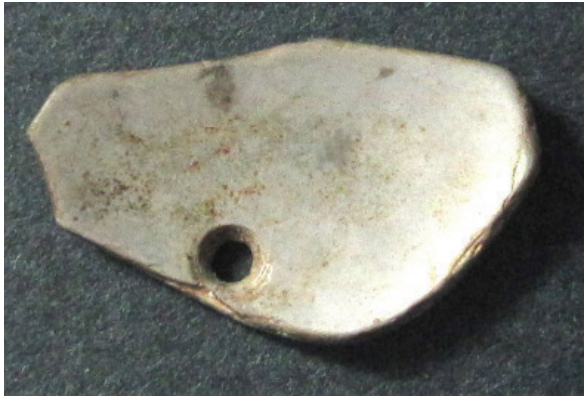
படம் 4.3 பாகியன்கல கற்குகையில் கண்டெடுக்கப் பட்ட சிப்பியைத் துளைத்து செய்யப்பட்ட கழுத்தில் அணியும் அட்டியல்.