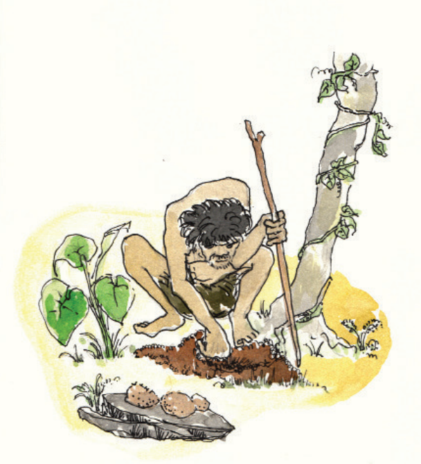
படம் 4.2 இயற்கையாக வளரும் கிழங்கு வகைகளை உணவாகக் கொள்ளவும் வேட்டை யுகத்தில் மனிதன் பழகியிருந்தமை.