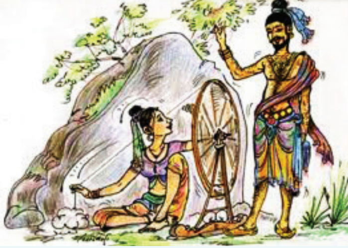
படம் : 4.6 - விஜயன் குவேனியை சந்தித்தல்

விஜயன் இலங்கைக்கு வரும் பொழுது இங்கு இயக்கர் நாகர் எனப்படும் மக்கட் குழுவினர் வாழ்ந்ததாக மகாவம்சம் குறிப்பிடுகின்றது. இயக்கர் குலத்தைச் சேர்ந்த குவேனி என்ற பெண் விஜயனின் குழுவினரை மாய சக்தியின் மூலம் பிடித்து ஒழித்து வைத்தாள். தன்னுடன் வந்தவர்களைத் தேடிச் சென்ற விஜயன் குவேனியை சந்தித்தான். அவ் வேளையில் அவள் நூல் நூற்றுக் கொண்டிருந்தாள் எனக் குறிப்பிடப்பட்டுள்ளது.